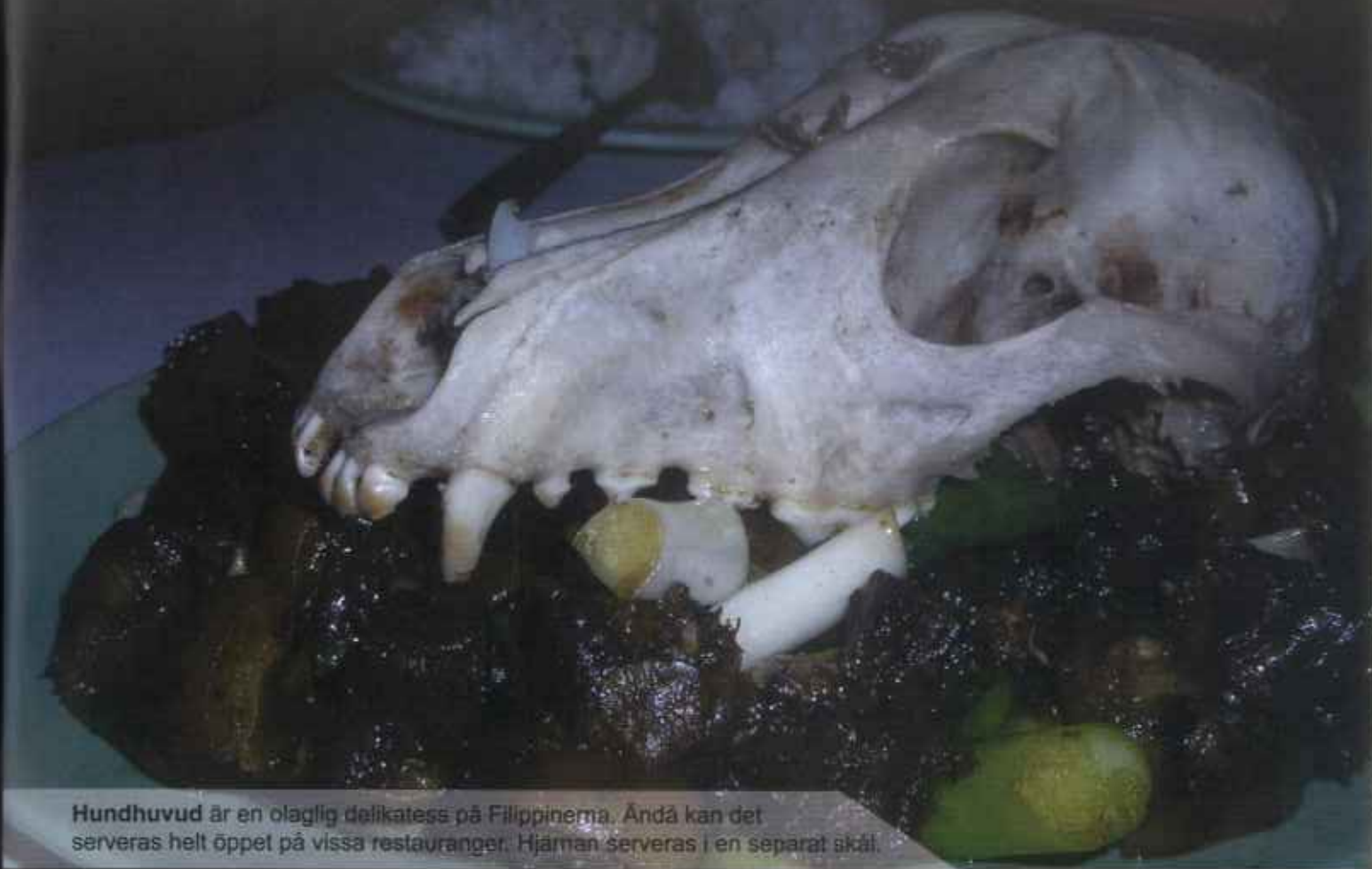
Hundhuvud är en olaglig delikatess på Filippinerna. Ändå kan det serveras helt öppet på vissa restauranger. Hjärnan serveras i en separat skål.