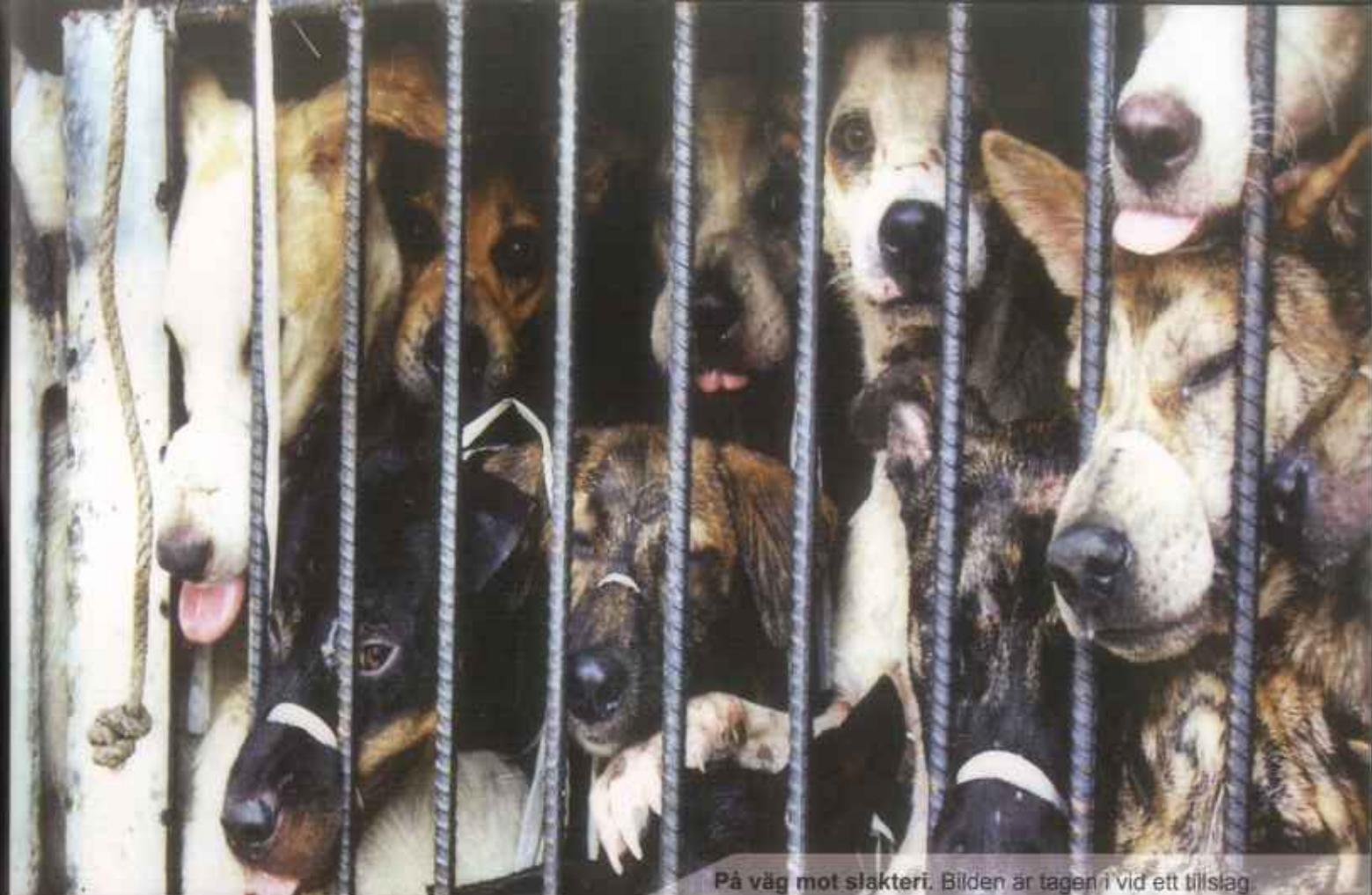
På väg mot slakteri. Bilden är tagen i vid ett tillslag