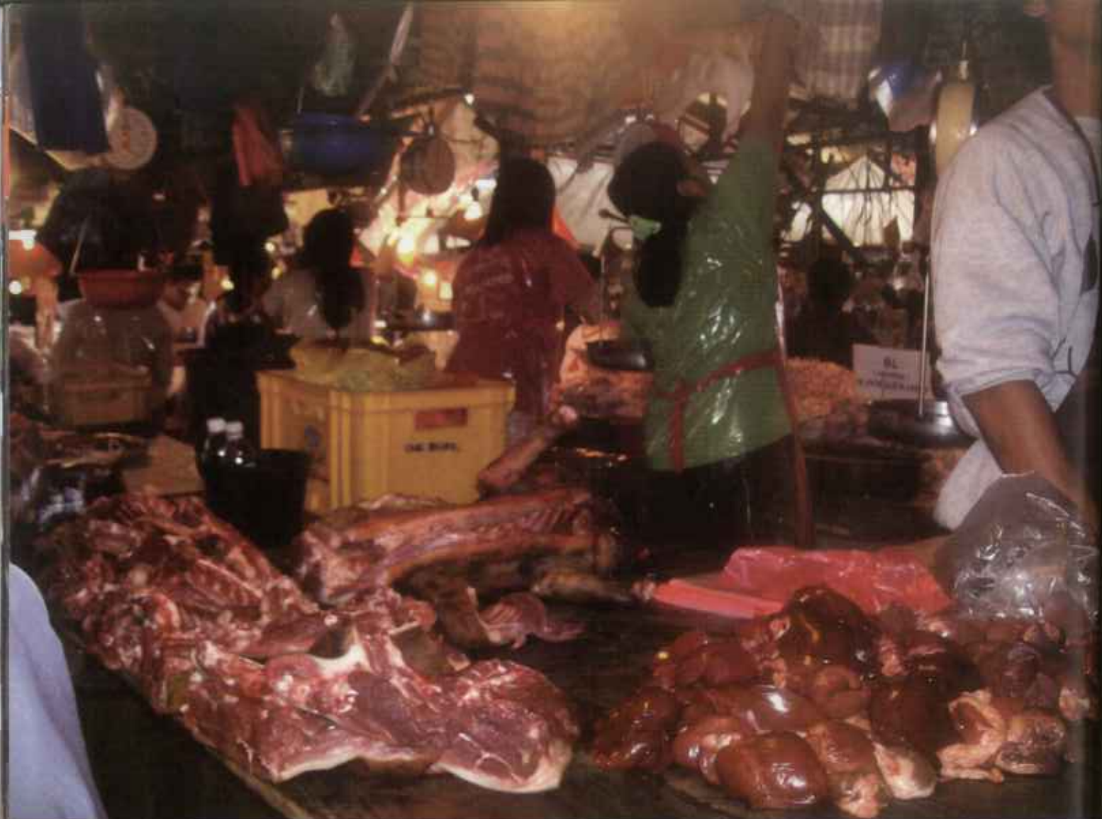
Omkring 400 hundar äts varje dag i den filippinska staden Baguio. På den illegala köttmarknaden som bilden är tagen på, säljs köttet helt öppet. Hundar styckas på plats och lukten av förruttelse, skräck och död sprider sig över hela området.