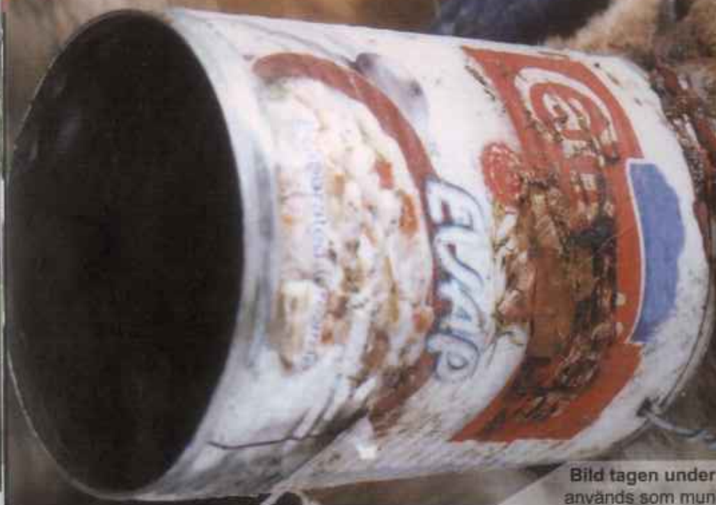
Bild tagen under en razzia. Rep och rostiga konservburkar används som munkorgar för att hindra skällande och bitande.

Animal Protection Networks reseskildring från ett antihundslaktprojekt på Filippinerna.